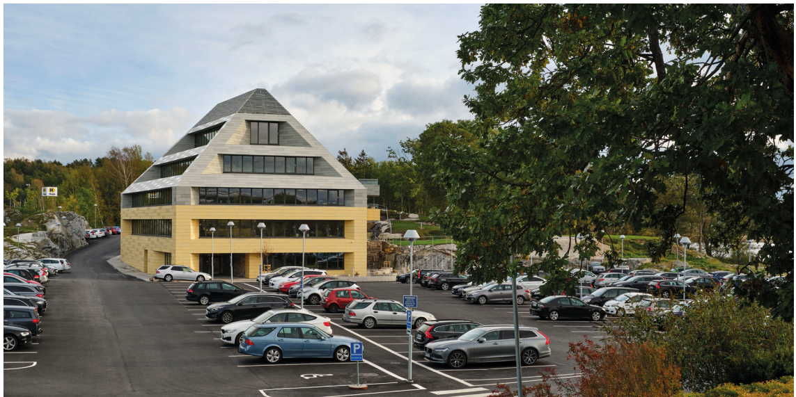
En del av Hogias huvudkontor vid Hakefjorden i Stenungsund.

Hogia AB, som under 2023 avverkade det 43:e verksamhetsåret, är moderbolag i en koncern som består av ca 30 helägda företag i Norden och Storbritannien. Den operativa verksamheten i koncernen bedrivs i dotterbolagen till Hogia AB. Externt benämner vi ofta koncernen som "Hogia-gruppen".