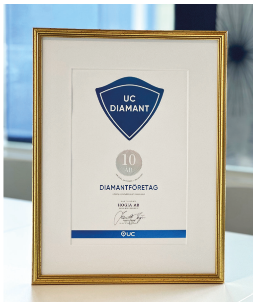
Hogia har fått utmärkelsen Diamantföretag.