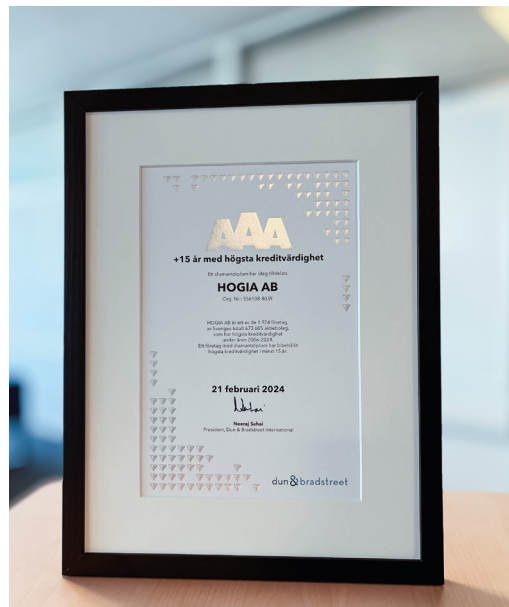
Triple-AAA Diamant för högsta kreditvärdighet.